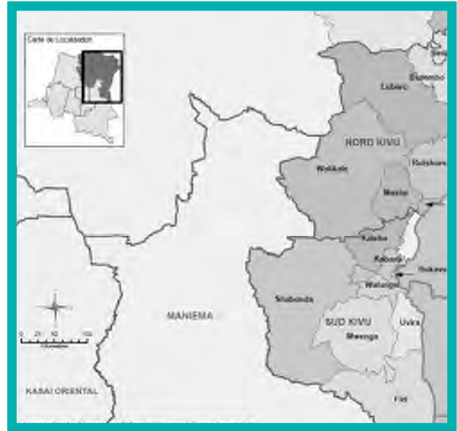
Carte du l'est du Congo