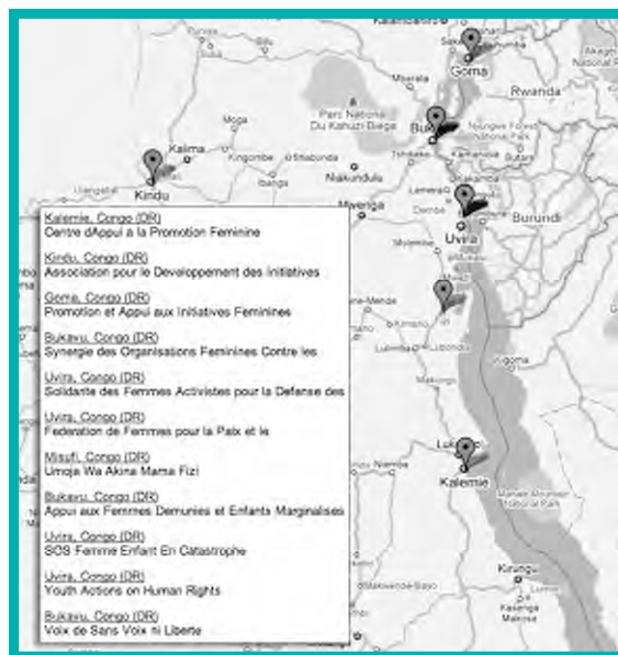
Sites des partenaires dans ce rapport

APPUI DU FMF: QUATRE SUBVENTIONS D'UN MONTANT GLOBAL DE 31 500 USD