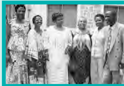
GFW advisors and grantees facilitated sessions at the DRC-Burundi-Rwanda GFW grantee convening held in Burundi, August 2008.