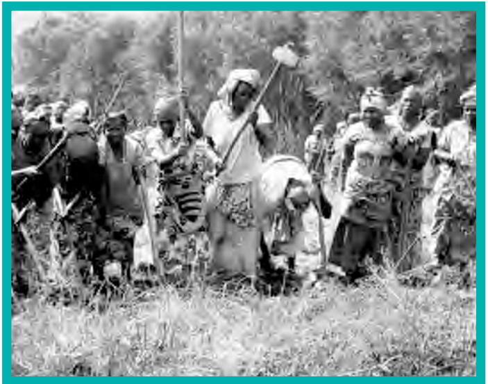
Displaced women supported by grantee SOFAD to resume agricultural activities after the war.

The above findings substantiated and complemented the accounts shared by women's groups in their proposals and final reports to the Global Fund for Women. We were interested to see whether women's groups could make further gains in improving the overall status of women with additional grants from GFW. Since 2004, several grantees have received two to three grants. Their experiences are shared in the next section and offer glimmers of hope in bringing meaningful change to the lives of not only rape survivors, but also all women and communities in eastern Congo.