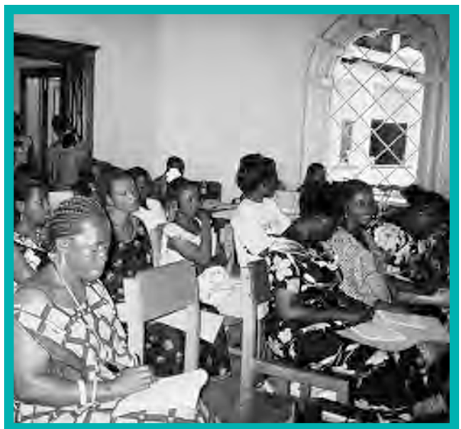
GFW grantees attend the GFW grantee convening in Uvira, January 2007.

CAPROF trains women in modern agricultural methods and provides basic agricultural tools in a context where the war severely disrupted farming activities and families barely eat one meal a day. In its pilot program, CAPROF worked with 150 farmers and improved their productivity by 70