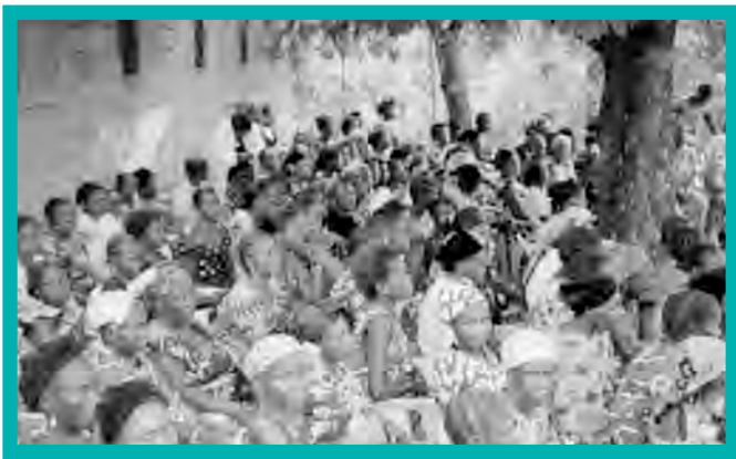
Women gather for GFW meeting on outskirts of Kinshasa, July 2007.

In recent years, grantees reported progress in linking, networking and collaborating with allied groups, which resulted in greater efficiency in their work. Several grantees specifically identified two opportunities for networking and collaboration supported by the Global Fund—the multi-country grantee convening in Burundi in August 2008 and the 2008 AWID conference in Cape Town—as critical to enhancing their roles within their countries. For example, following YAHR’s participation in the Global Fund grantee convening, the group assumed a place in a national women’s development network.