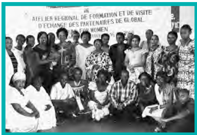
Une réunion regroupant des conseillères et partenaires de GFW de Rwanda, Burundi et l'est du Congo, au Burundi, en août 2008.

La Synergie des Organisations Féminines Contre les Violences Faites aux Femmes (SOFCVFW) est un réseau de 230 groupes œuvrant dans les environs de Bukavu qui sensibilise le public sur la violence contre les femmes et mène des activités de plaidoyer en faveur de l'adoption de mesures punitives. Elle a utilisé une subvention du FMF en 2007 pour organiser des marches dans le cadre des «16 jours d'activisme sur la violence contre les femmes» en novembre 2007. Elle a également