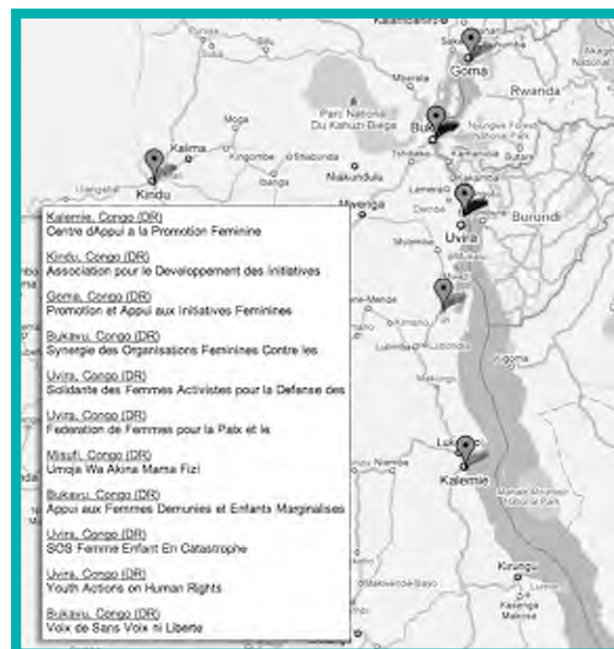
Location of grantees profiled

GFW SUPPORT: FOUR GRANTS TOTALING $31,500