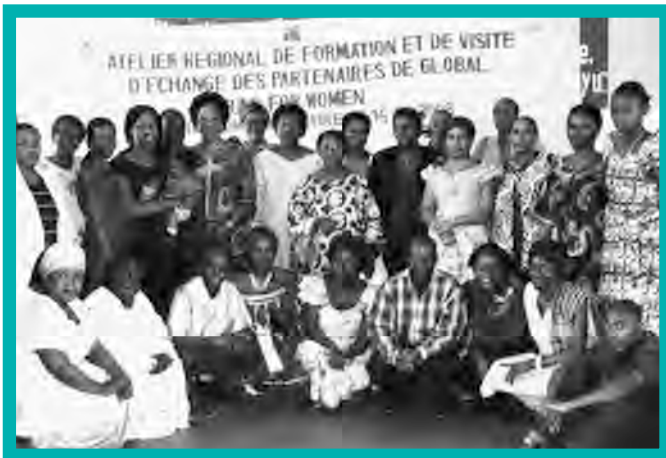
GFW grantees from Burundi, Rwanda and eastern DRC met in Burundi August 2008 to develop joint plans.

When it comes to building peace from the ground up, no women's network stands out like SOFAD. Founded in 2001 in Uvira, DRC, Solidarité des Femmes Activistes pour la Défense des Droits Humains (SOFAD) (Women Activists in Solidarity for the Defense of Human Rights) has as its goal the promotion of women's rights, peace, and the rule of law. A succession of peace accords has not stopped armed conflict in DRC. SOFAD is convinced that communities must be part of the solution. The group trains women activists to be strong voices in the local