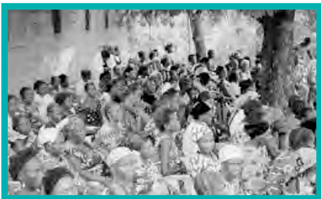
Les femmes de la périphérie de Kinshasa participent dans une réunion avec GFW, juillet 2007.

la RDC, les résultats tardent à devenir concrets, mais les mouvements des femmes continuent de mener des activités de plaidoyer dans un domaine qui est dominé par les hommes et dans lequel l'aspect équité de genre manque. De façon informelle mais tout aussi critique, des groupes tels que la SOFAD complètent les processus de paix officielles par des processus communautaires. Son réseau de comités villageois pour la paix reflète un besoin pour les processus informels impliquant régulièrement les populations, garantissant ainsi que les accords de paix soient mis en œuvre, acceptés et maintenus sur le long terme.