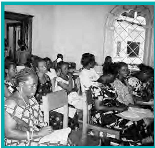
Une réunion des bénéficiaires du financement du GFW à Uvira, janvier 2007.

L'Association pour le Développement des Initiatives Féminines au Maniema (ADIF- Maniema). Après avoir constamment été témoin des violations massives des droits des femmes dans la province de Maniema dans l'Est de la RDC, un groupe de citoyens concernés ont créé l'ADIF-Maniema en 2000 avec pour objectif la protection des femmes et des enfants, l'instauration de la paix dans la région, l'accroissement de la sécurité alimentaire et économique pour les femmes, et l'organisation des sensibilisations à la santé. L'ADIF travaille spécifiquement avec les femmes rurales qui ont été violées, les mères adolescentes et les membres des groupements des femmes. Le groupe s'est bâti une réputation de prise de risques dans une région instable. Dans une société connue