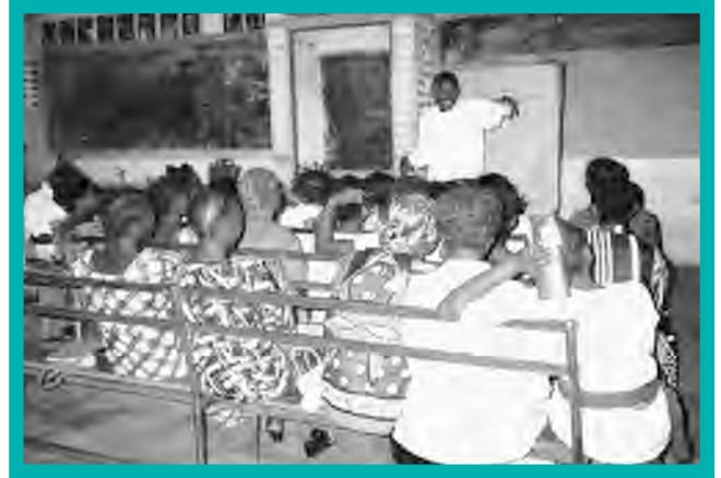
Des jeunes à Uvira participent dans des formations sur la paix, la démocratie et le droits de l'homme, organisé par YAHR.

APPUI DU FMF: DEUX SUBVENTIONS DE 11 000 USD