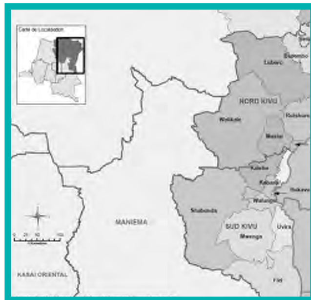
Over more than a decade, North and South Kivu provinces (shaded) have experienced the heaviest armed conflict and gender violence (country map top left).