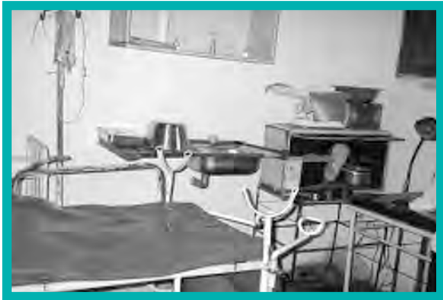
Centre de maternité géré par INOAF, à Kinshasa.