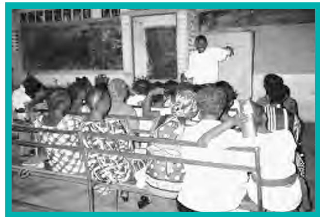
Youth in Uvira attend human rights, peace, and democracy dialogues hosted by grantee YAHR.